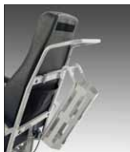
AC0066 PORTA BOMBOLA