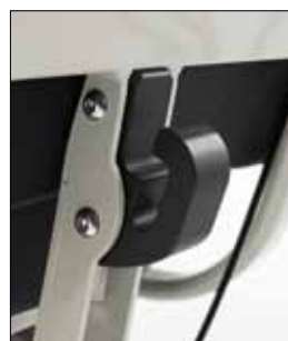
AC0067 KIT SUPPORTO PORTA BOMBOLA