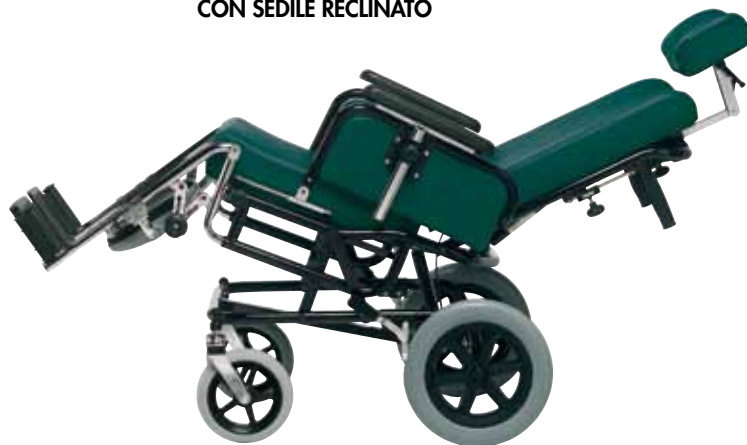
CON SEDILE E SCHIENALE RECLINATO