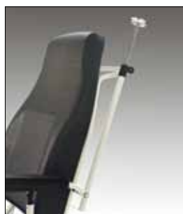
AC0065 ASTA PORTAFLEBO