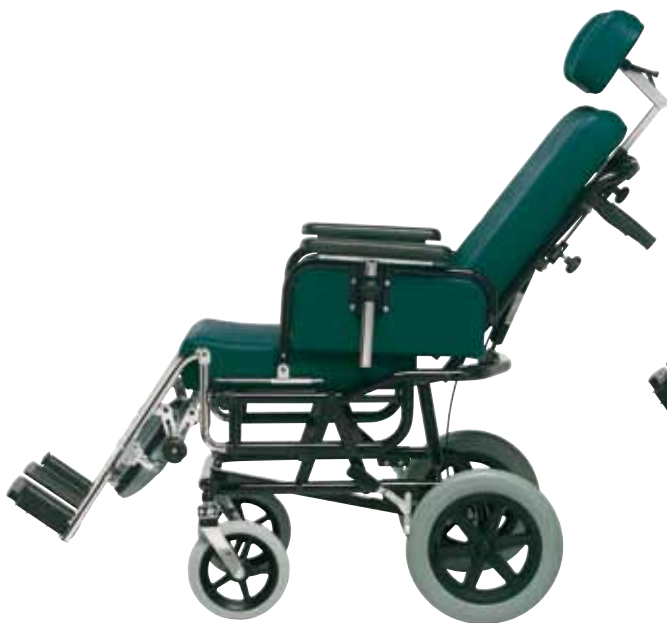
CON SCHIENALE RECLINATO