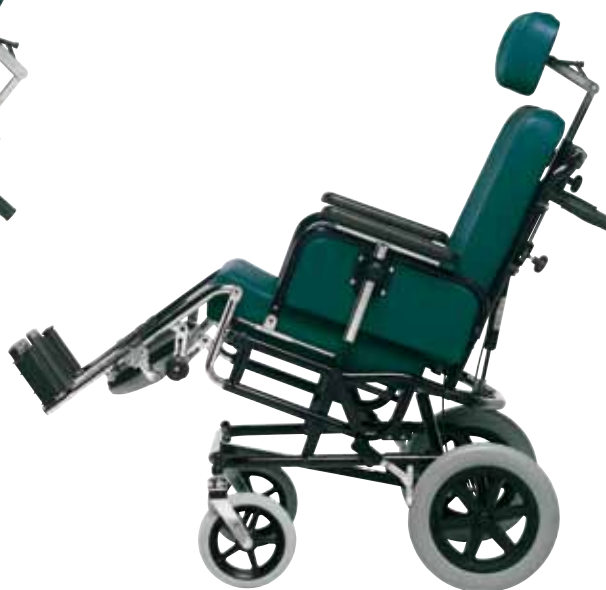
CON SEDILE RECLINATO