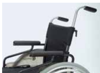
Particolare delle maniglie di spinta regolabili